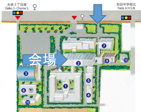
○配置図(大幸キャンパスマップ)